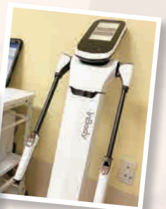
リハビリに必要な機器や設備が揃っています