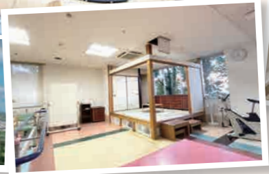
リハビリテーション室の様子