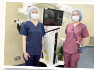
手術室でシミュレーション中