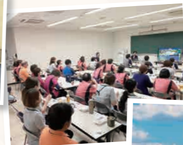
整形外科区による骨粗鬆症の勉強会