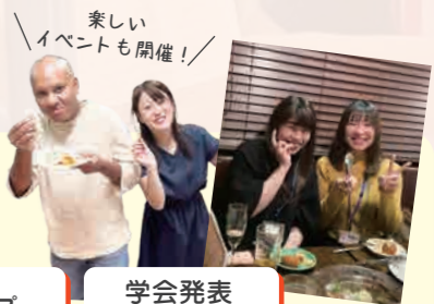
楽しいイベントも開催!

所沢白翔会病院は、地域に密着したケアミックス型病院として これから皆さんと作り上げていく病院です!