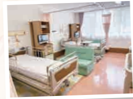
新しい病室もオープン